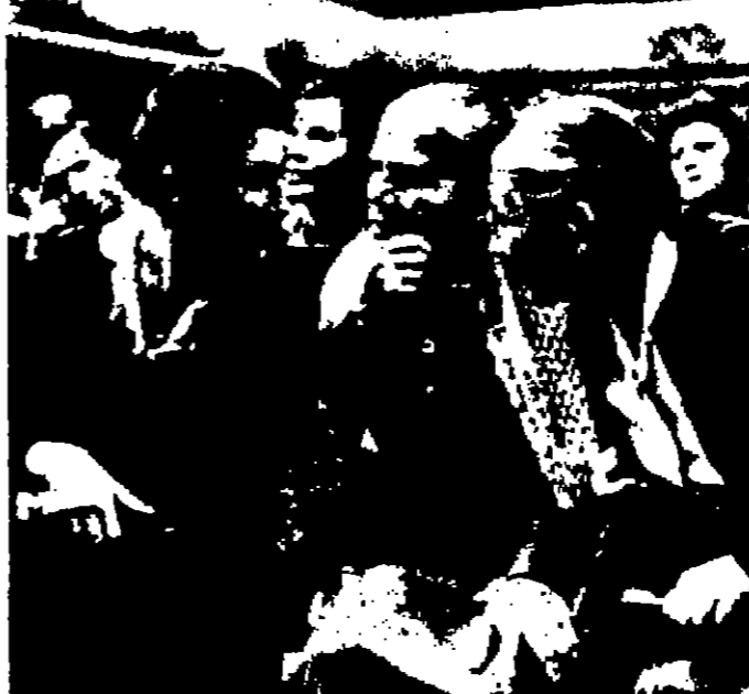
لجميع المجتمعات ، وفي الاجتماعات والزعم ، وفي الشوارع ، نفس منذ الوهلة الاولى ان نساء موسكوبزن على عدد الرجال

المدرسة الوطنية الارثوذكسية - تعلن - عن افتتاح مدرسة سبئية لجميع الطلاب لمختلف الاعيار وذلك اعتباراً من صباح يوم الاثنين الموافق ٢٤ الجاري ولغاية ٤ آب ١٩٦٨ . يتخمن برنامج هذه الدورة نشاطات رياضية وفنية ورحلات بالاضافة الى تقوية بالغات والرياضيات . التسجيل يومياً ما عدا ايام العطلة الرسمية من الساعة التاسعة الى الساعة الثانية عشرة ويحكم الاصل بالدراسة هاتنيا بالرغم ٢٥٥٦٢ للحصول على اية معلومات اضافية . الادارة